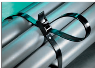
SpeedyTie® – Schnell und einfach.