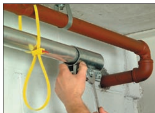
SpeedyTie® ist für die temporäre, aber starke Befestigung besonders geeignet.