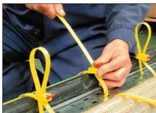
Die Bandenden lassen sich besonders unkompliziert zurückschlaufen.