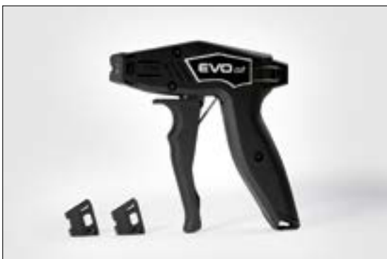
EVOcut inklusive drei austauschbaren Stirnkappen.