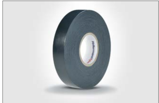
Das Hochspannungsband HelaTape Power 820 erzeugt eine durchgehende, luftdichte Ummantelung.