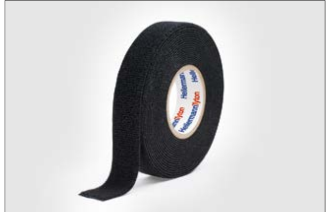
HelaTape Protect 1500 ist extrem weich und bietet höchste Geräuschdämmung.