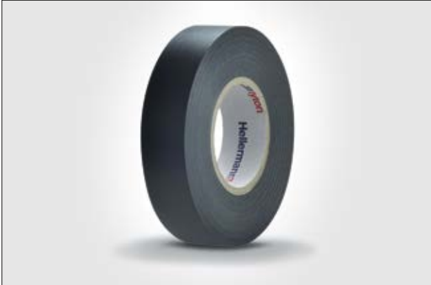
HelaTape Flex 20: Dickere Isolierbandstärken ermöglichen einen schnelleren Schichtaufbau.