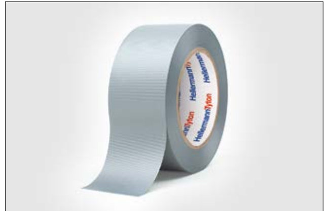
HelaTape Allround 1500 - Universelles PVC-Klebeband.