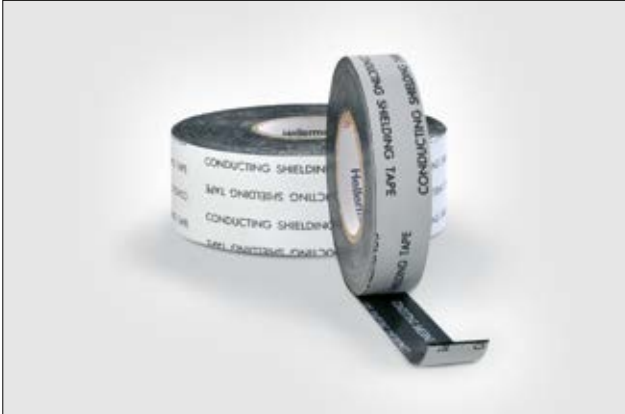
HelaTape Shield 310 ist ein leitfähiges EPR-Band zur Abschirmung von Mittelspannungskabeln.