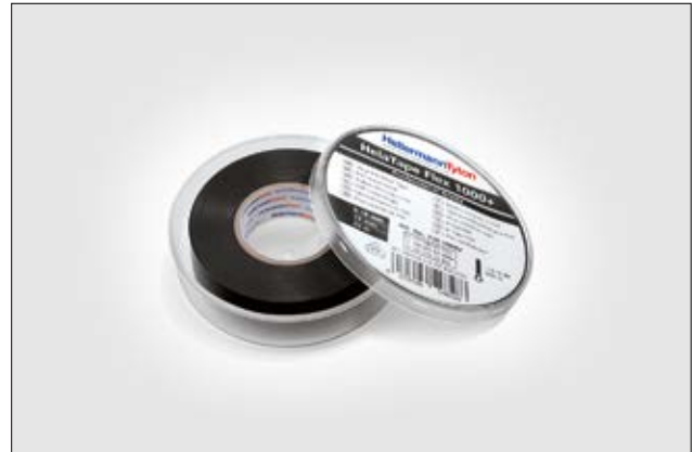
Das Premiumisolierband HelaTape Flex 1000+ lässt sich sehr gut bei niedrigen Temperaturen verarbeiten.