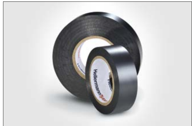
HelaTape Flex 2000+ ist das professionelle PVC-Isolierband mit höherer Materialstärke.