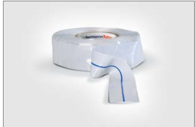
HelaTape Power 800: Die Mittellinie erleichtert das überlappende Wickeln.