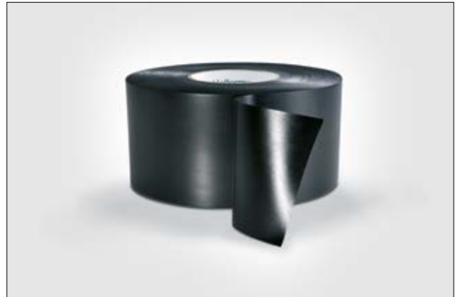
HelaTape Wrap 25 schützt sowohl frei- als auch erdverlegte Rohre und Masten.