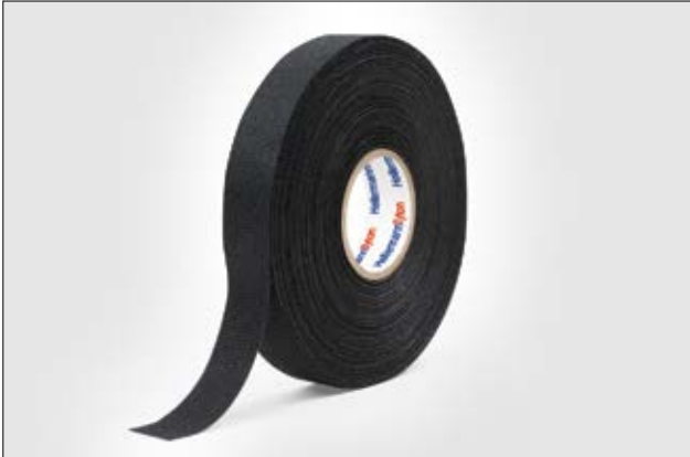
HelaTape Protect 300 bietet eine hohe Geräuschreduzierung und Abriebchutz.