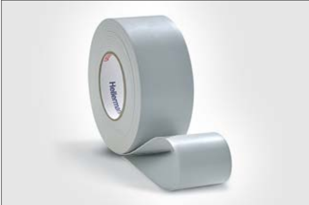
HelaTape Power 410 dient zum Brandschutz von Kabeln.