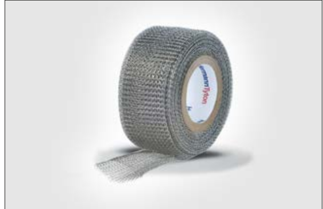
HelaTape Shield 320 bietet eine ausgezeichnete metallische Abschirmung.