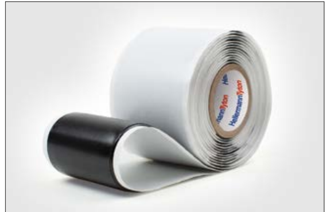
HelaTape Power 660 ist ein flexibles Dicht- und Polsterband.