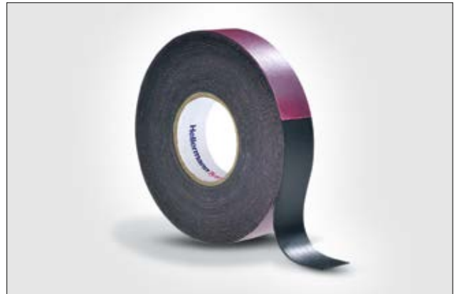
HelaTape Power 600 ist ein selbstverschweißendes Kautschukband für den Niederspannungsbereich.