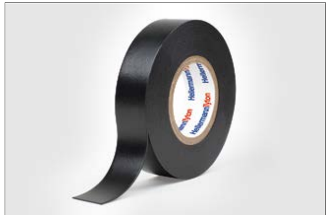
HelaTape Power 715 ermöglicht eine schnellere Verarbeitung durch die fehlende Trennfolie.