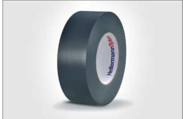
HelaTape Flex 25 für besonders hohe Anforderungen.