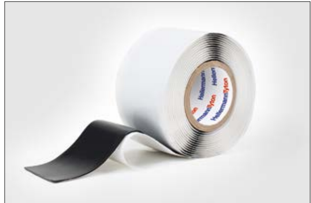
Hatape Power 670 bietet einen zusätzlichen Vinylfilmschutz für die Mastikverbindung