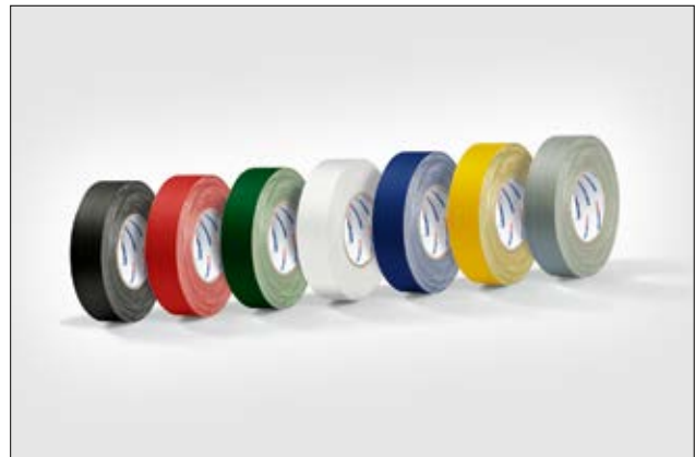
Helatape Tex ist in unterschiedlichen Größen und Farben erhältlich.