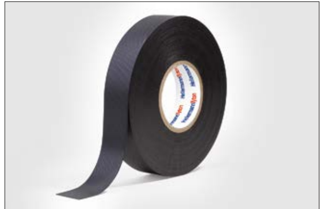
HelaTape Power 700 ist ein selbstverschweißendes Mittelspannungsband.