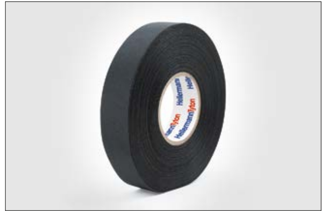
Helatape Protect 250 bietet als Wickelband eine sehr hohe Temperaturbeständigkeit.