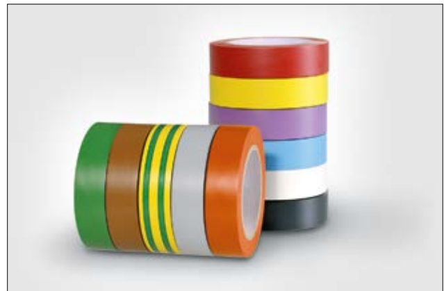
Hohe Flexibilität bei guter Klebekraft macht HelaTape Flex 15 universell einsetzbar.