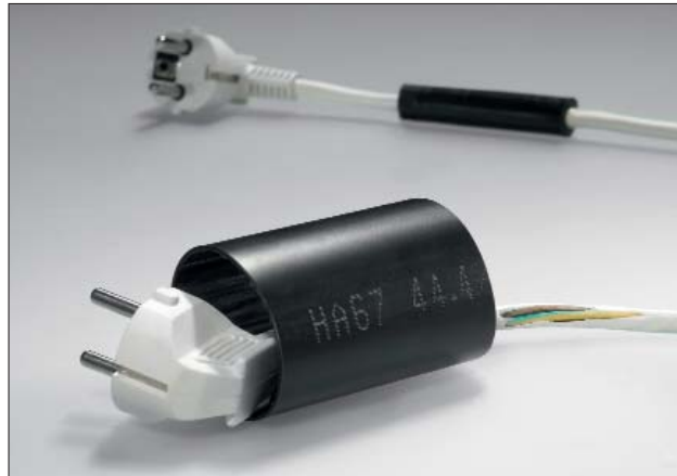
Der HA67 eignet sich besonders für Reparaturen, bei denen z.B. Stecker überwunden werden müssen.

Isolation, Abdichtung und mechanischer Schutz bei großen Durchmesserunterschieden, komplexen Steckerkonfigurationen oder schwierigen geometrischen Formen.