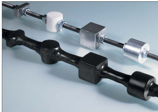
Durch die große Schrumpfrate können auch komplexe geometrische Formen sicher umschumpft werden.