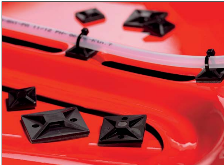
Durch das SolidTack®-Klebeband können die Sockel auch auf lackierte Oberflächen geklebt werden.

Diese Produkte kommen bei pulverlackbeschichteten oder lackierten Oberflächen, wie sie z.B. im Schaltschrank-, Schienenfahrzeug-, Flugzeug- oder Fahrzeugbau zu finden sind, zum Einsatz. Daneben können sie auf Kunststoffverkleidungen, -schutzabdeckungen und -bauteile geklebt werden, welche in vielen anderen Industriezweigen verwendet werden.