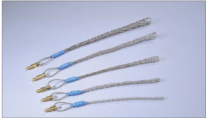
Kabelziehstrümpfe sind in fünf unterschiedlichen Größen und damit für ein breites Spektrum an Kabel-durchmessern erhältlich.

Kabelziehstrümpfe werden durch Zusammen-drücken aufgeweitet und über das zu befestigende Objekt gestülpt. Sie bieten eine ver-läßliche Möglichkeit, Kabel oder Rohre sicher zu befestigen.