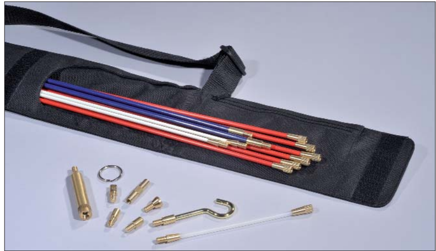
Alle Komponenten des Cable Scout+-Luxus-Sets im Überblick.

Cable Scout+ ist ein multifunktionales Werkzeug zur professionellen Kabelinstallation, das die zeitsparende Verlegung von Kabeln unter schwierigsten Bedingungen ermöglicht. Stangen aus glasfaserverstärktem Kunststoff (GFK) können dabei mit einem Kabelgewicht von bis zu 80 kg belastet werden. Das komplette System beinhaltet Glasfaserstangen, eine Vielzahl an nützlichen Zubehörteilen und eine robuste Tasche, in der alle Komponenten sicher verstaut werden können.