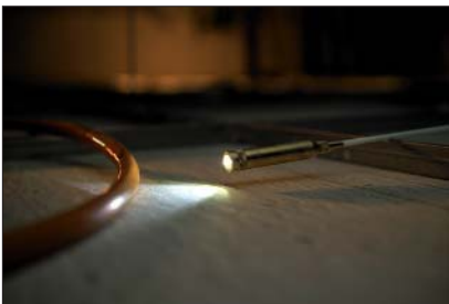
Die Cable Scout+-Leuchte ist perfekt für die Inspektion von Hohlräumen geeignet.

Aufgrund seiner Auswahl an Zubehörteilen und unterschiedlichen Flexibilitäten ist Cable Scout+ für viele Anwendungen hervorragend geeignet.