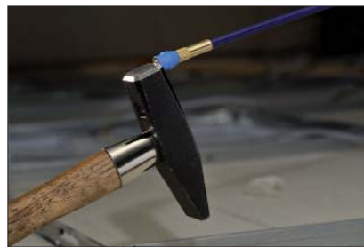
Der starke Magnet kann Metallgegenstände von bis zu 2,5 kg Gewicht heben.