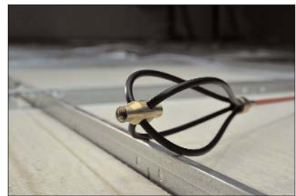
Der Gleitauflauf erleichtert das Führen von Kabeln und Leitungen über raue und unebene Oberflächen.